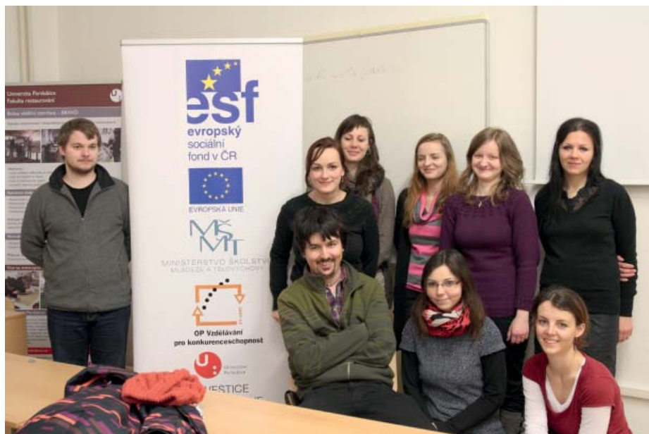
V březnu a dubnu tohoto roku proběhly první dvě studentské minikonference. Svě zkušenosti z praktických stáží představili kolegům studenti v Litomyšli (nahore) i v Turnově (dole).